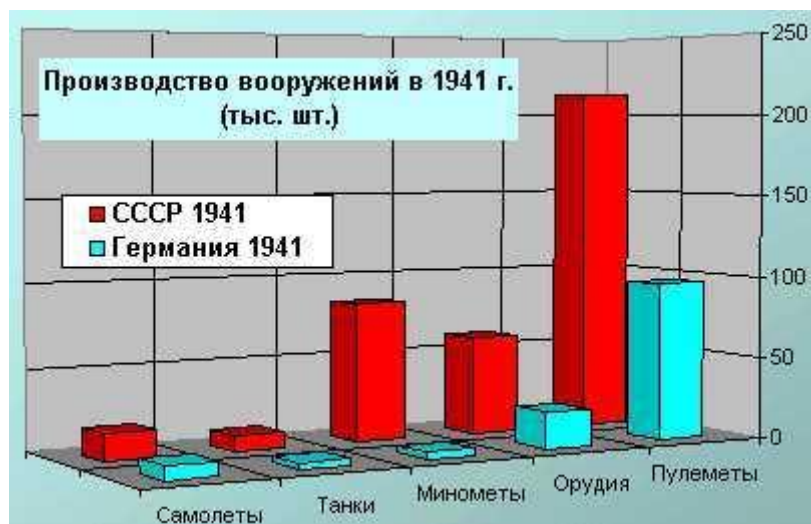
Рис. 1. Графическое представление некоторых данных из табл. 2 за 1941 год [5].

Н.А. Вознесенский делает два важных, по нашему мнению, вывода. Первый вывод заключается в следующем. Концентрация всех имеющихся в народном хозяйстве СССР ресурсов на базе единой государственной собственности послужила экономической основой военного хозяйства СССР. "...Экономической основой военного хозяйства СССР является господство социалистической собственности на средства производства, которое обеспечило сосредоточение всех материальных сил народного хозяйства СССР для победоносного ведения Отечественной войны" [1].